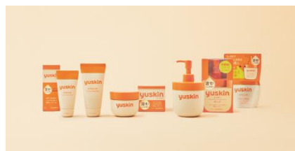
ユースキン (販売名:ユースキン Aa) 指定医薬部外品

ひび・あかぎれ・しもやけを治す黄色いクリーム「ユースキン」は、チューブ・ボトル・ポンプのラインナップで、シーンに合わせてお使いいただけます。